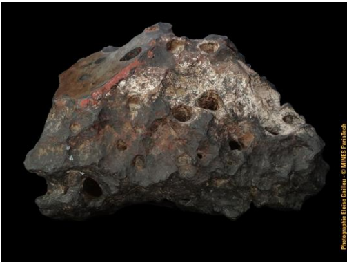
L'imposante météorite de Canyon Diablo de la collection du Musée de Minéralogie MINES ParisTech (#10870, 48 x 37 x 35 cm, 226,80 kg).

Les météorites de Canyon Diablo ont également fait parties de nombreuses études qui ont permis de déterminer l'âge de la Terre à environ 4,55 milliard d'années , grâce à des analyses isotopiques Uranium-Plomb par Clair Cameron Patterson en 1956.