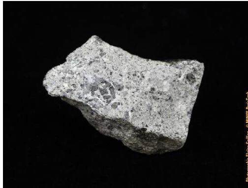
Météorite de Jonzac, dans la collection du Musée de Minéralogie MINES ParisTech (#24539 ; 3.2 x 2.3 x 1.9 cm), donnée par G.J. Adam en 1881.

* Les Diogénites : l'origine de ces météorites serait de la croûte profonde de l'astéroïde Vesta. Elles sont composées de roches ignées d'origine plutonique, qui se sont solidifiées lentement en profondeur de la croûte de Vesta, formant des cristaux de plus grandes tailles que ceux constituant les eucrites. Ces cristaux sont principalement des orthopyroxènes (riches en Mg) avec un peu de plagioclase et d'olivine.