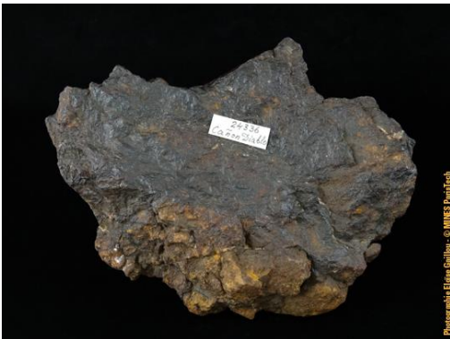
Météorite de Canyon Diablo, dans la collection du Musée de Minéralogie MINES ParisTech (#24336 ; 13.6 x 11 x 4.5 cm).