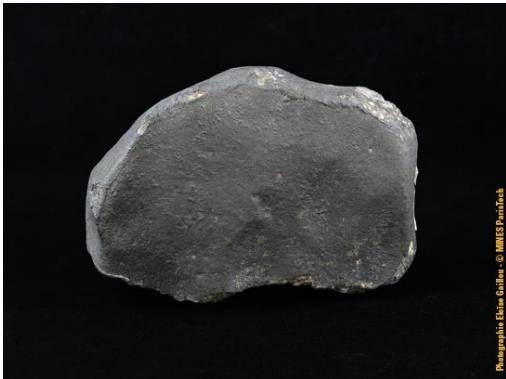
Météorite de l'Aigle, dans la collection du Musée de Minéralogie MINES ParisTech (#6043 ; 9.1 x 6.5 x 4.8 cm), donnée par Lambotin.

- Météorites de l'Aigle en Basse-Normandie. Dans l'après-midi du 26 Avril 1803, sur la commune de l'Aigle, une forte détonation se fait entendre, accompagnée d'une chute de près de 3000 fragments de roche. C'est cet événement qui permettra de déterminer de l'origine extraterrestre des météorites. Les météorites de l'Aigle se révèlent être des chondrites ordinaires (groupe L6).