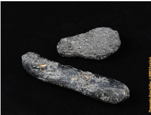
Tectites du Cambodge dans la collection du Musée de Minéralogie MINES ParisTech (#6048 ; 5.4 x 2.8 x 1.6 et 9.3 x 2 x 1.9 cm). Ces tectites ont été données au Musée de Minéralogie par le célèbre géologue Alfred Lacroix.