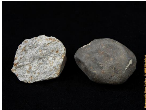
Deux météorites de l'Aigle, dans la collection du Musée de Minéralogie MINES ParisTech (#24505 et 24506 ; 4.3 x 3.2 x 2.6 cm et 3.9 x 3.5 x 3.5 cm), données par G.J. Adam en 1881.