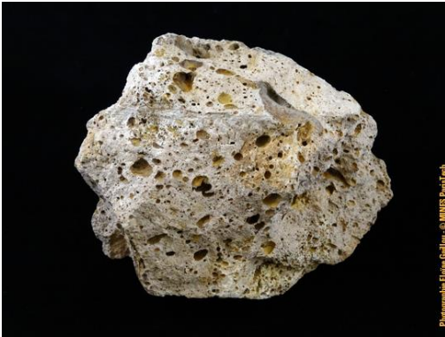
Brèche de type Babaudus dans la collection du Musée de Minéralogie MINES ParisTech (#80804 ; 12.5 x 9 x 8.5 cm).