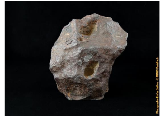
Météorite de Canyon Diablo, dans la collection du Musée de Minéralogie MINES ParisTech (#24475 ; 10.5 x 9 x 4 cm), donnée par Eckley Coxe en 1892.