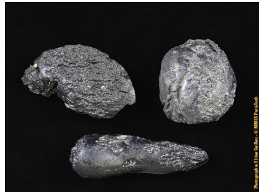
Tectites du Cambodge dans la collection du Musée de Minéralogie MINES ParisTech (#6049 ; 7.4 x 2.4 x 2 cm, 4.9 x 4 x 2.5 cm et 6.7 x 3.6 x 2.5 cm). Ces tectites ont également été données au Musée de Minéralogie par le célèbre géologue Alfred Lacroix.