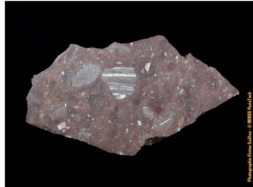
Tranche sciée non polie d'une brèche de type Montoume dans la collection du Musée de Minéralogie MINES ParisTech (#83386 ; 19 x 10 x 3 cm).