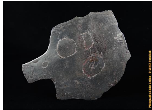
Petite tranche de la météorite de Canyon Diablo prélevée sur l'imposant échantillon dans la photo précédente. C'est sur cet échantillon qu'ont été découverts parmi les premiers diamants provenant de météorites, dès 1892 (#6024 ; 14.8 x 11.5 x 3.4 cm). Le bloc original a été donné par Eckley Coxe en 1892.