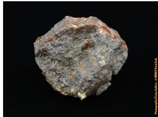
Météorite de Morristown dans la collection du Musée de Minéralogie MINES ParisTech (#24326 ; 4.6 x 3.9 x 3.1 cm).