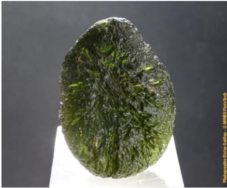
Moldavite dans la collection du Musée de Minéralogie MINES ParisTech (#15675 ; 4.6 x 3.4 x 1.8 cm).

* Le terme de verre lybique est réservé à une tectite retrouvée dans la grande mer de sable du désert de Libye, généralement de couleur jaune clair. Ce verre lybique aurait été généré par une météorite qui aurait explosé à une altitude d'environ 10 à 20km, provoquant une radiation de chaleur qui aurait fait fondre le sable environnant à une température d'environ 2000°C. Le verre lybique se serait formé il y a environ 29 millions d'années.