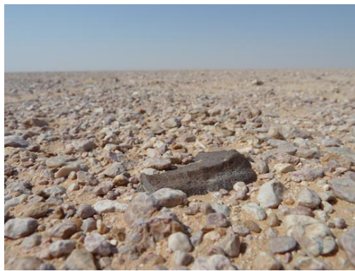
Météorite martienne découverte par le chasseur de météorite Luc Labenne en Oman en Novembre 2010.

* Les Shergottites : Ce sont des roches ignées martiennes, vraisemblablement arrachées à des vitesses supérieures à la vitesse de libération de Mars (5,0km/s) à proximité de terrains volcaniques, suite à un impact. Leur âge de formation est très jeune (150 à 200 millions d'années) et ces météorites montrent souvent des traces de métamorphisme de choc. Leur nom est tiré de la 1ère chute de ce type, tombée en 1865 près du village de Shergotty, en Inde.