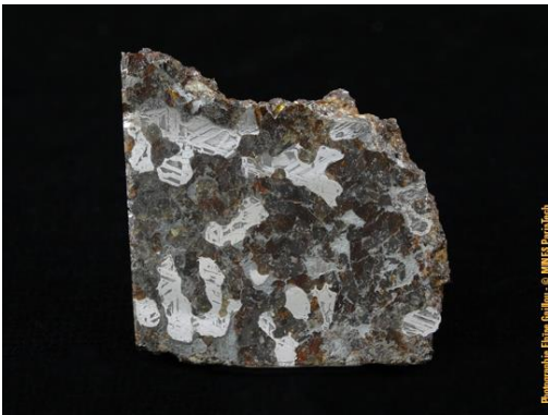
Météorite de Rittersgrün, dans la collection du Musée de Minéralogie MINES ParisTech (#24282 ; 5 x 3.4 x 3.3 cm), provenant du leg d'Emile Bertrand en 1910.

* Mésosidérites de Rittersgrün, en Allemagne; de Vaca Muerta au Chili; de Morristown, et de Crab Orchard, dans le Tennessee (USA); d'Estherville dans l'Iowa (USA), météorite de Mincy, Taney Co. dans le Missouri (USA).