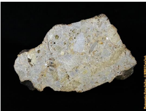
Tranche sciée, non polie d'une brèche de type Rochechouart dans la collection du Musée de Minéralogie MINES ParisTech (#83383 ; 17.5 x 10 x 6.2 cm).

- L'astroblème de Rochechouart (cratère impactant Rochechouart et Chassenon en Haute-Vienne). Il y a près de 200 millions d'années, une météorite de 1,5 km de diamètre percute la Haute-Vienne à une vitesse d'environ 20 km / s. Le cratère (encore appelé astroblème) formé est d'au moins 21 km de diamètre et ravage tout à plus de 100 km. Le choc détruit la météorite et les roches percutées. Des débris sont projetés à plus de 400 km. Sur place, un trou béant large de 25 km se creuse et des roches sont modifiées sur plus de 5 km de profondeur. Si l'érosion a complètement effacé le relief de cet impact, les roches touchées conservent l'empreinte de ce drame : elles sont fracturées, fondues, et remélangées, et constituent des brèches. Suivant la localité, l'allure des brèches est différente. Nous vous en présentons quelques-unes dans la collection du Musée de Minéralogie.