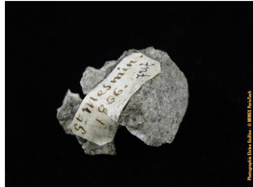
Recto et verso de la météorite de Saint-Mesmin dans la collection du Musée de Minéralogie MINES ParisTech (#24538 ; 2 x 1.5 x 1.2 cm), donnée par G.J. Adam en 1881.