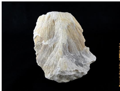
Shatter cone de Vista Alegre au Brésil, de la collection du Musée de Minéralogie MINES ParisTech, donné par J. Touret (#80807 ; 16 x 12.6 x 4 cm)

Ce sont des roches présentant une allure en " queue de cheval " et qui sont liées à des cratères d'impacts météoritiques (ou des explosions nucléaires, les énergies délivrées étant similaires). Si ce genre de roches est trouvée en place, elles prouvent l'origine météoritique plutôt que volcanique d'un cratère. Grâce à leur allure caractéristique, les shatters cones sont facilement identifiables sur le terrain (voir photo ci-dessous). En général, le cône pointe vers le centre de l'impact, qui se situe généralement à plusieurs kilomètres du cône lui-même.