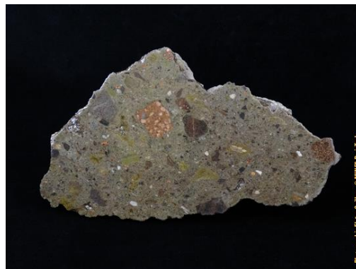
Tranche sciée, polie et vernie d'une brèche de type Chassenon dans la collection du Musée de Minéralogie MINES ParisTech (#80803 ; 15.7 x 9 x 1.3 cm).