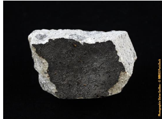
Recto et verso d'une des météorites du Teilleul dans la collection du Musée de Minéralogie MINES ParisTech (#6047 ; 4.4 x 3 x 2.6 cm), donnée par Retout-Dary en 1845.