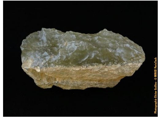
Verre lybique dans la collection du Musée de Minéralogie MINES ParisTech (#15457 ; 12.2 x 6.5 x 6.2 cm).