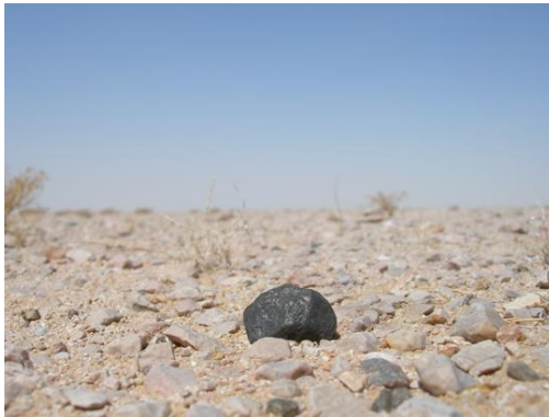
Météorite lunaire découverte par le chasseur de météorite Luc Labenne en Oman le 12 avril 2008.

Tout comme pour les météorites martiennes, on retrouve des « bouts de Lune » sur la Terre suite à des impacts d'astéroïdes avec la Terre. L'exposition présente deux météorites lunaires, prêtées par le chasseur de météorites Luc Labenne.