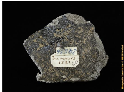
Recto et verso de la météorite de Juvinas dans la collection du Musée de Minéralogie MINES ParisTech (#24536; 4.4 x 4 x 2.8 cm), donnée par G.J. Adam en 1881.

- Eucrite de Jonzac, en Charente-Maritime. Le 13 Juin 1819, une "pluie de météorites" est observée, et deux roches sont retrouvées. La collection MINES ParisTech compte un échantillon de cette météorite historique.