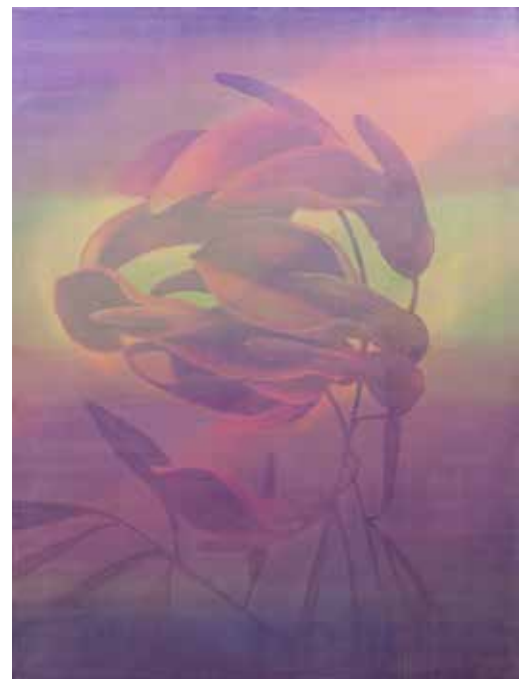
Pink Flamingo , 2016 Acrylique et huile sur toile, 96 x 130 cm

Edouard Wolton extrait de l'acrylique et de l'huile toutes leurs propriétés chimiques et capacités chromatiques. Travaillés en plusieurs formats et en fines couches successives de glacis, ces portraits floraux tiennent plus de l'imaginaire que d'une représentation purement mimétique. La proposition de Wolton n'est pas celle d'une démonstration botanique, ni celle d'une nature prise sur le fait. Les arums, les orchidées ou encore les cactus servent ici de supports à la rêverie et aux projections de l'esprit. En parfait coloriste, il troque la sévérité objective du dessin scientifique contre un langage expressif coloré.