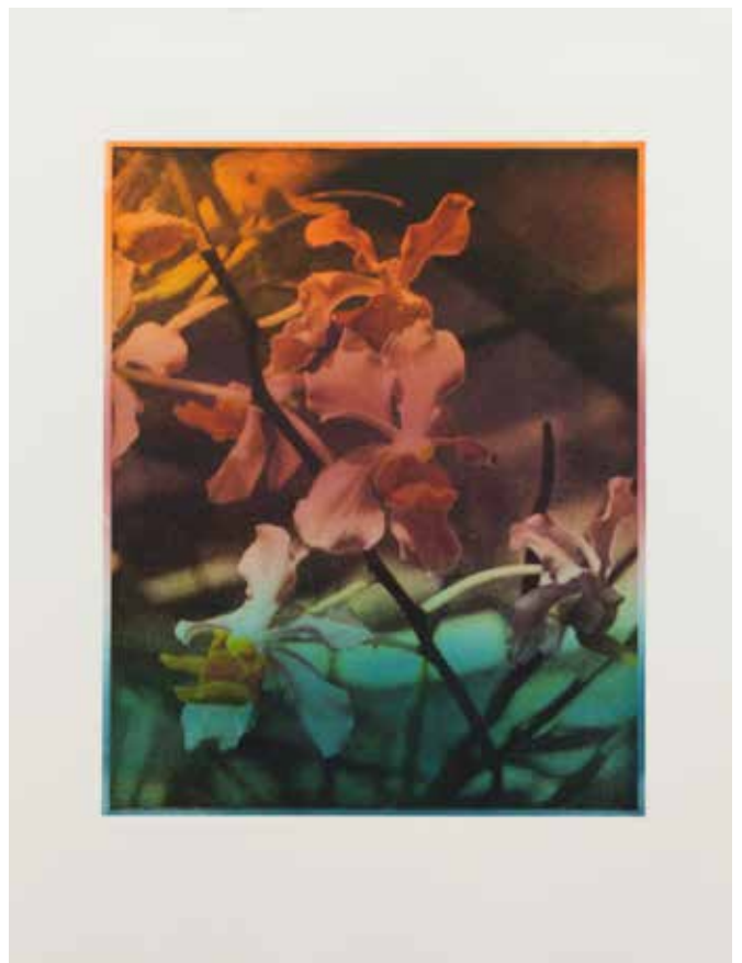
Blue Velvet , 2016 Alugraphie sur papier BFK Rives, 56 x 76 cm Edition de 5