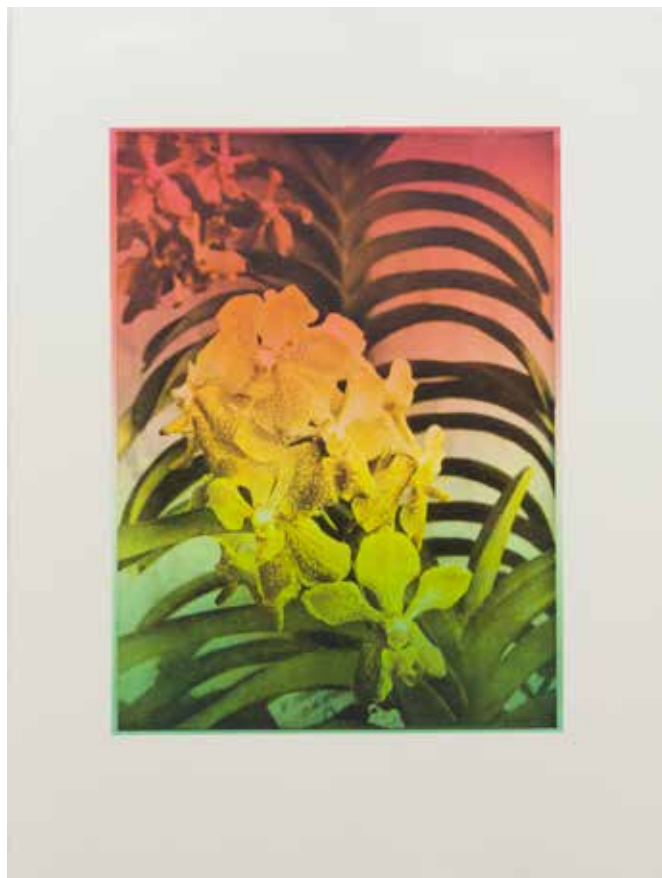
Léopard , 2016 Alugraphie sur papier BFK Rives, 56 x 76 cm Edition de 5