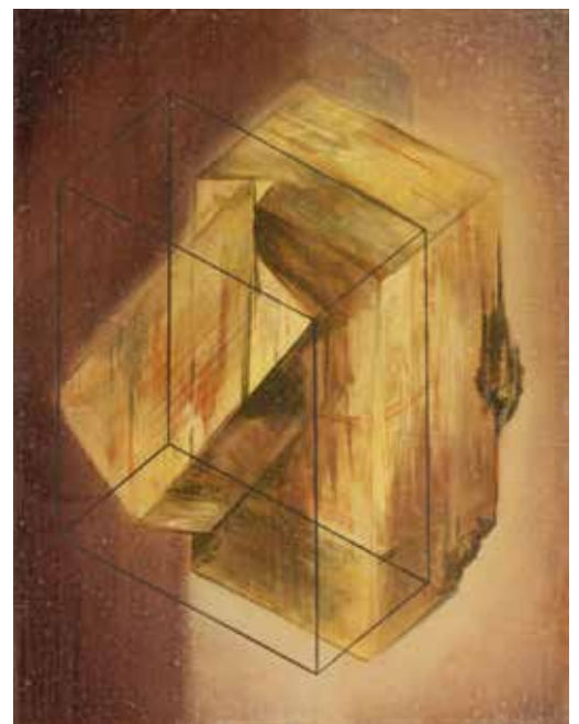
Structure, 2016, Acrylique et huile sur toile 26,5 x 35 cm