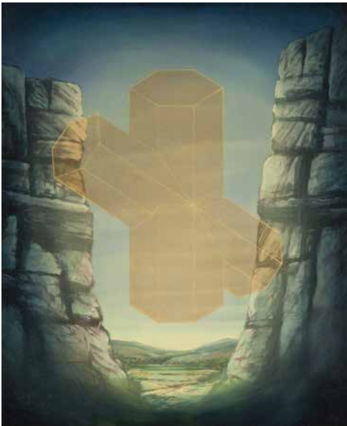
Macle Stavrodite, 2016, Acrylique et huile sur toile, 60 x 73 cm