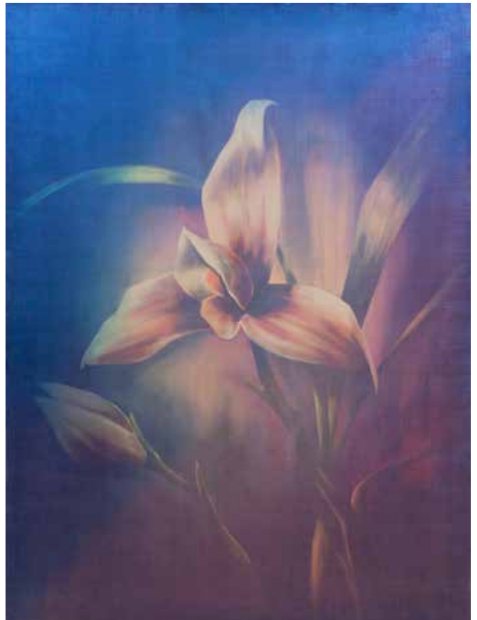
Blue Lady , 2016 Acrylique et huile sur toile, 96 x 130 cm