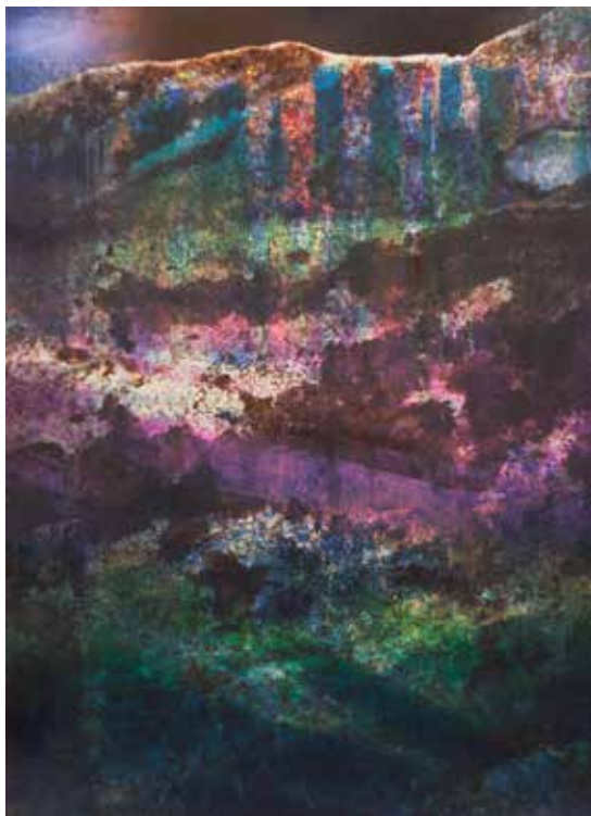
Opale , 2016 Tirage quadrichromique jet d'encre pigmentaire et monotypes à l'encre lithographique sur papier Hahnemühle Etching Muséum 350 gr. (Tirage unique)

Par ailleurs, les tableaux, présents dans la première partie de l'exposition entretiennent un rapport étroit et personnel entre structure minérale et histoire de l'art alors que les toiles de petits formats, accrochées en tête des travées font apparaître les pierres comme des astres qui percent la nuit, comme les points de lumières qui surgissent lors de leur découverte dans les mines.