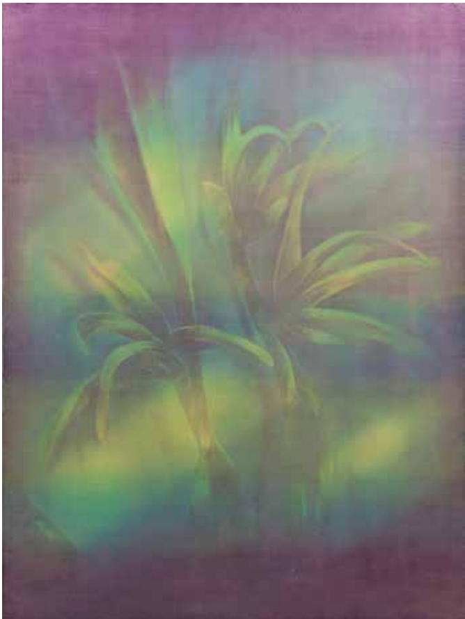
Blue flamingo , 2016 Acrylique et huile sur toile, 96 x 130 cm