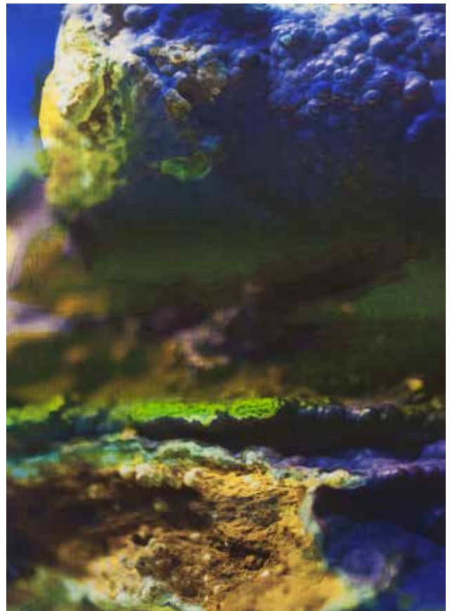
Azurite, 2016, Tirage quadrichromique jet d'encre pigmentaire et monotypes à l'encre lithographique sur papier Hahnemühle Etching Muséum 350 gr. (Tirage unique)